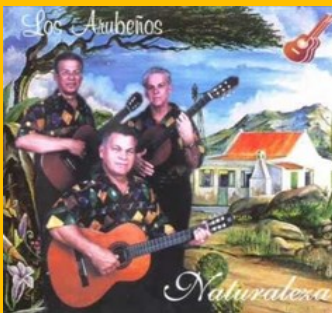
Trio Los Arubeños cu Naturalesa